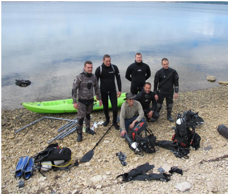
Podvodne istraživanje u sklopu globalnog projekta „ZEN – Zostera Experimental Network“ voditelj: Smithsonian Institution, USA, www.zenscience.org

Studenti i osoblje zainteresirani za dodatne informacije o programima mobilnosti mogu se obratiti Uredu za međunarodnu suradnju Sveučilišta. Ured za međunarodnu suradnju redovito organizira informativne aktivnosti vezane za programe mobilnosti čiji sažetak možete pronaći na mrežnim stranicama .