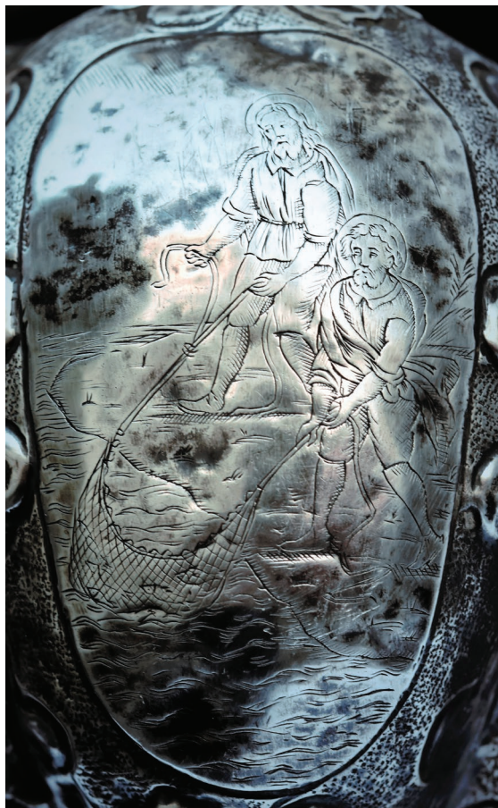
Nepoznata mletačka radionica, Detalj visećeg svijećnjaka Bratovštine Presvetog Sakramenta – dar riječkih ribara , 1. polovica 18. stoljeća, Župna crkva Uznesenja Blažene Djevice Marije, Rijeka