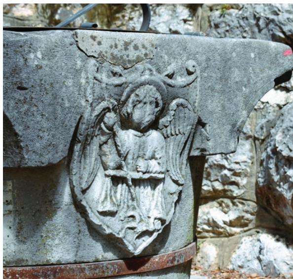
Kruna cisterne - detalj, Bribir