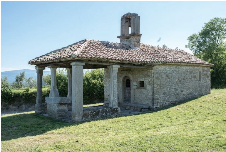
Crkva sv. Roka, Draguč