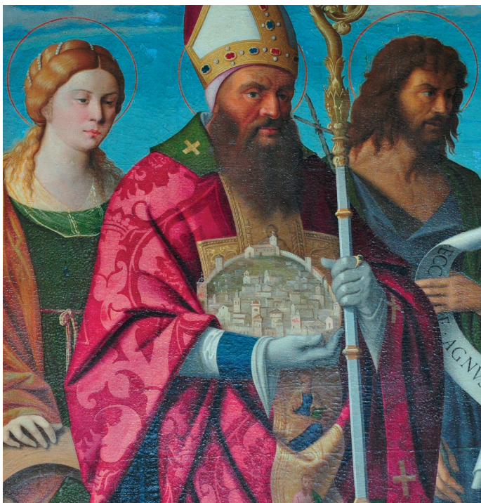
Girolamo da Santa Croce, Poliptih na glavnom oltaru, detalj sv. Katarine, sv. Kvirina i sv. Ivana Krstitelja, 1535., crkva Navještenja Blažene Djevice Marije, Košljun