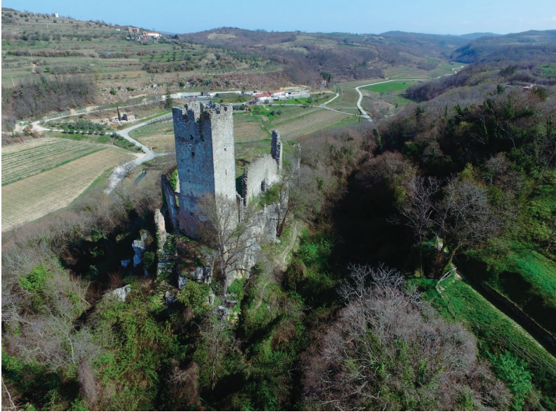
Kaštel Momjan, utvrda se prvi put spominje u 13. stoljeću