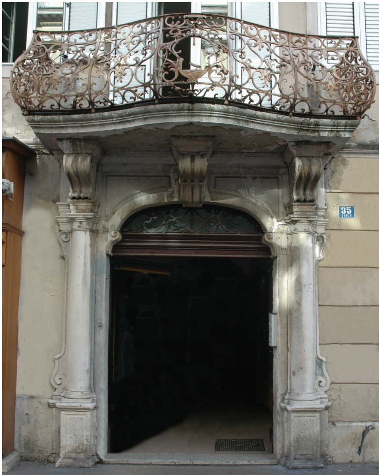
Portal palače Batthyány, 1784., Rijeka