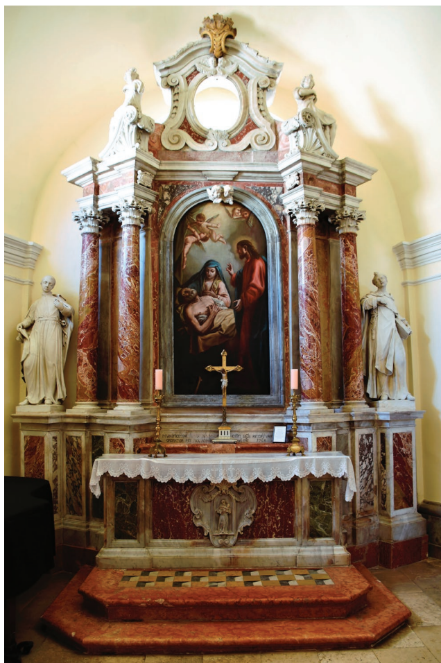
Altar svetog Josipa, oko 1760., katedrala u Senju