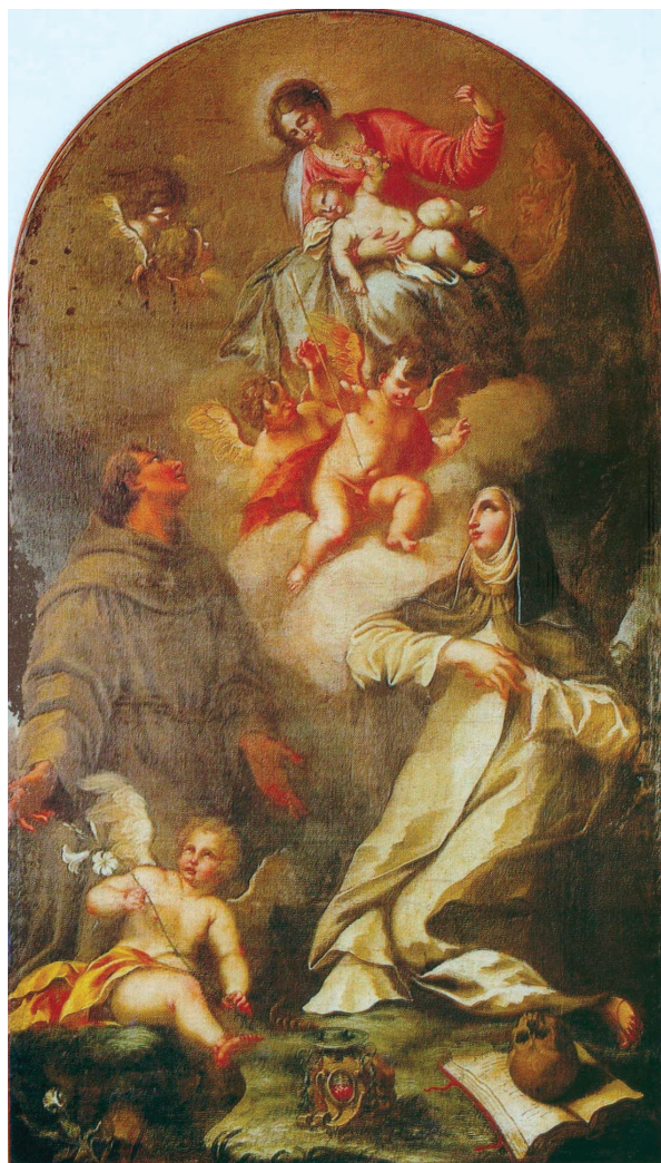
Nepoznat autor, Gospa s Djetetom, sv. Antom i sv. Terezom Avilskom , početak 18. stoljeća, župni dvor, Tisno