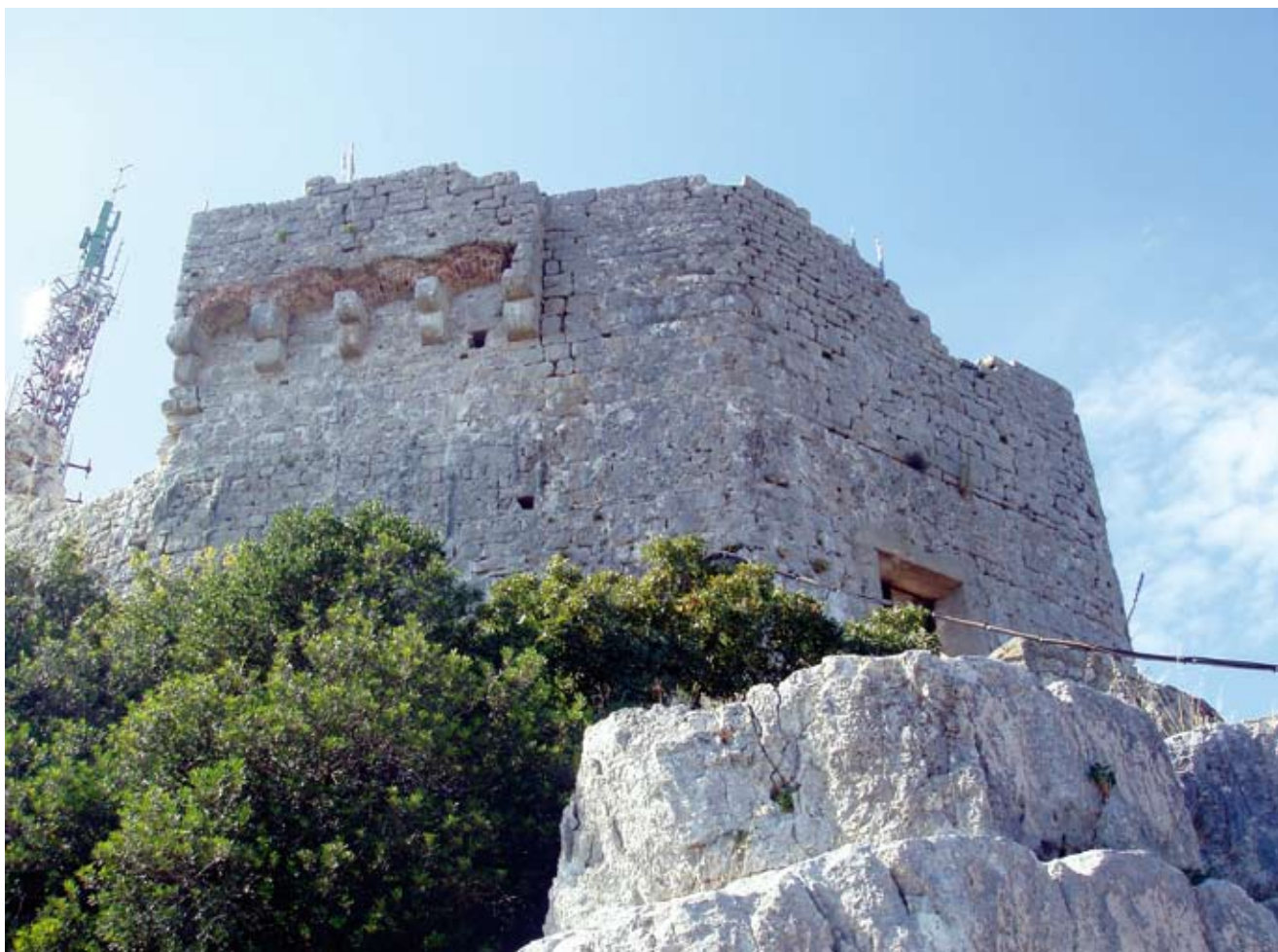
6. Istočni dio zidina