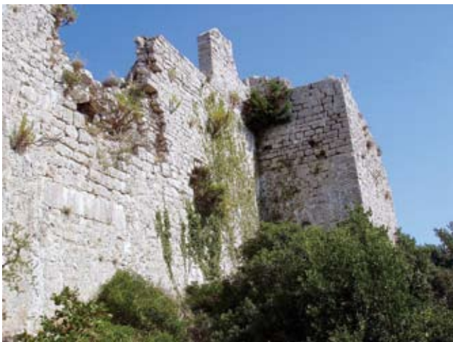
7. Stari ulaz na jugozapadu i južna kula

Old entrance in the south-western section and the south tower