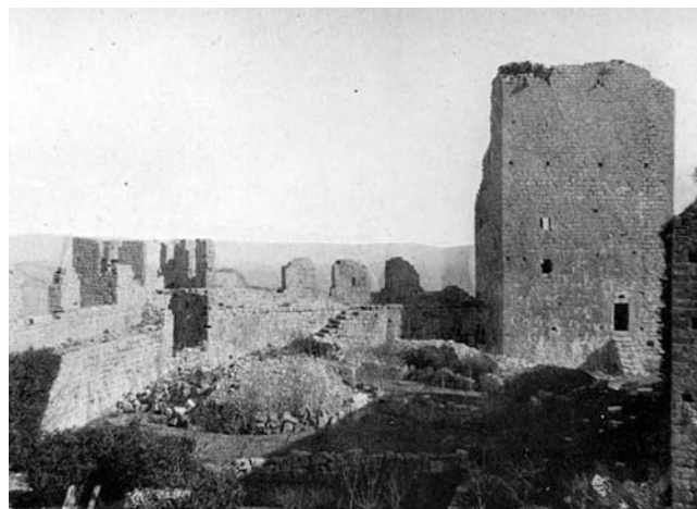
2. Unutrašnjost kaštela s donjonom na početku 20. st.

Interior of the fort with the donjon tower in the early twentieth century