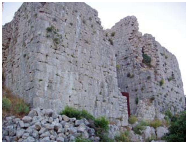
5. Donjon i ulazna kula