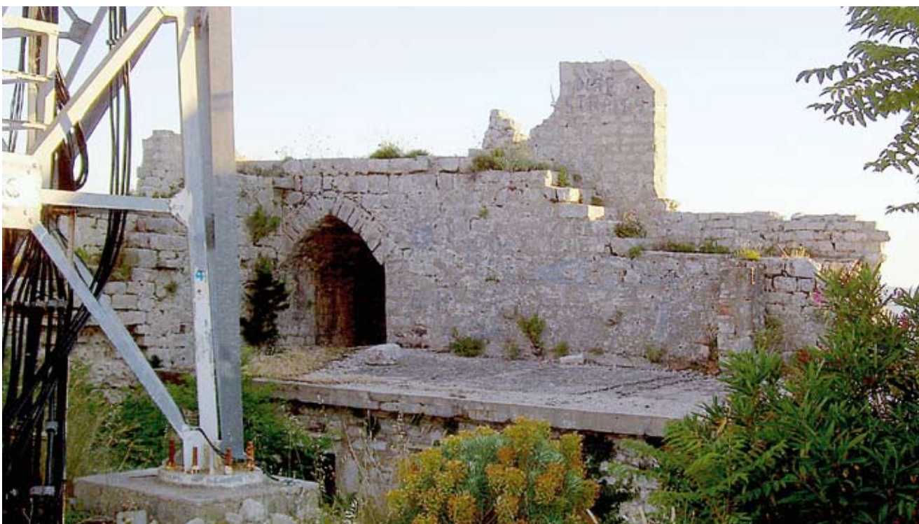
8. Južni potez zidina s otvorom južne kule

20. stoljeća (sl. 2), te na crtežima F. Salghetti-Driolija iz 19. stoljeća (sl. 3). 48 Postoje tri ulaza u kaštel, dva izvorna su zazidana, a onaj novijeg datuma probijen je u sjeveroistočnom zidu. Glavni ulaz nalazio se s jugozapadne strane kaštela, koja je okrenuta moru i gdje se nalazi mala zaravan, dovoljna za pristup vratima. Vjerojatno je zbog lakog prilaza vratima taj ulaz ubrzo nakon gradnje bio zazidan. Sastoji se od pravokutnog otvora s masivnim nadvratnikom. Drugi, manji ulaz nalazi se na suprotnoj strani utvrde okrenutoj Zadru. Smješten je između velike kule ( donjona ) i produžetka obrambenog zida koji tvori mali propugnakul (sl. 4). Do njega vodi usko strmo stubište djelomično usječeno u živu stijenu. Oblik ulaza odgovara tipičnom romaničkom portalu s lunetom. Dovratnici su sastavljeni od više kamenih blokova od kojih se pojedini horizontalno uvlače u zidnu masu, a na njima leži masivan nadvratnik. Luneta je ispunjena zidnom masom i uokvirena glatkim klesanim okvirom. Glavna kula utvrde nalazi se sjeverno od spomenutih vrata, skoro je kvadratnog tlocrta, širine 8,5 i dužine oko 7 metara. Prema opisu L. Benevenije, krajem 19. stoljeća unutrašnja raspodjela na katove više nije postojala, ali vidjele su se rupe za grede podova, a još uvijek je stajao i svod na vrhu kule. Nad svodom se nalazila terasa s jednom do dvije kamene klupe. Pod