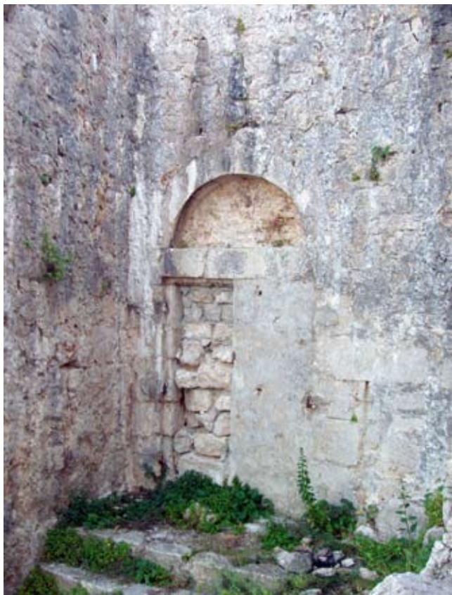
4. Sjeveroistočni ulaz u kaštel

odbijanju rušenja kaštela ležao u pojačanoj nesigurnosti Republike u odnosima s ugarskim kraljem, pa bi im kaštel u slučaju rata svakako bio dobrodošao. 34 No, kako je uskoro bio sklopljen mir s Ugarskom, opasnost je nestala i prijedlog o rušenju je obnovljen 30. rujna iste godine. Mletački Senat je tada zatražio rušenje crkve, zvonika i cisterni na takav način da to mjesto više nikad ne bi moglo poslužiti kao utvrda. Redovnicima je bilo dozvoljeno da iskoriste materijal iz ruševina i sagrade sebi kuću i crkvu u nizini. 35 Međutim, prijedlog je opet bio odbijen i umjesto rušenja kaštela, radi smanjenja troškova, bila je smanjena vojska u drugim gradovima. 36 Dugotrajno oklijevanje rušenja kaštela Sv. Mihovila, za razliku od utvrde Sv. Kuzme i Damjana, koja je bila srušena pri prvom prijedlogu, moglo bi dijelom biti zasluga opata Petra, koji je na toj dužnosti bio od 1340. do 1364. godine, dakle kroz cijeli period opsade, napada i opetovanih prijedloga o rušenju utvrde. Naime, opat Petar Zadrani bio je značajna osoba benediktinskog reda na zadarskom području, a osobito se istaknuo revnošću obnavljanja crkava u vlasništvu samostana u kojima je bio opat, od kojih su najpoznatije crkve na Čokovcu i u Rogovu. 37 Sačuvani crteži porušene crkve