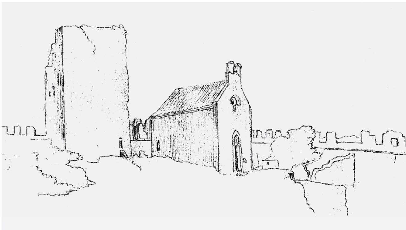
9. F. Salghetti-Drioli, Pogled na crkvu sa zapada

Sjeverno od ostataka velike kule, vidljiva i na spomenutoj fotografiji, nalazi se manja kula s kruništem koja je danas prilično porušena. Dio sjeverozapadnog zida pokraj nje djelomično je istaknut i ojačan škarpom. Iznad današnjeg ulaza na istočnom dijelu zidina sačuvao se povišeni dio zida, koji s vanjske strane počiva na konzolama (sl. 6). U jugozapadnom dijelu utvrde okrenutom prema tzv. srednjem kanalu nalaze se dvije bolje sačuvane kule, između kojih je zazidan nekadašnji glavni ulaz (sl. 7). Obje kule imaju nepravilan četvrtast tlocrt i presvođene su prelomljenim gotičkim svodom u visini ophoda. Zapadna kula je s vanjske strane ojačana škarpom, a prema unutrašnjosti utvrde otvarala se velikim gotičkim lukom koji je naknadno bio zazidan, te su u njemu otvorena manja vrata i prozor. Unutrašnjost te kule s gotičkim svodom najbolje je sačuvan dio kaštela. Južna kula ima nešto uži gotički otvor (sl. 8), a zanimljiva je zbog sačuvanog nužnika, zapravo dvaju otvora, od kojih se jedan nalazi u svodu, a drugi točno