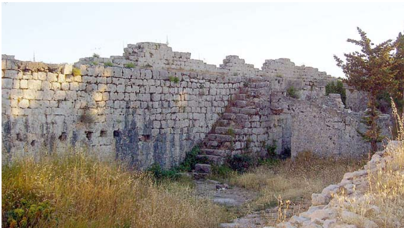
10. Unutrašnjost kaštela, jugoistočni potez zidina

glavnom je drvenom oltaru stajala uokvirena oltarna slika s likom Sv. Mihovila, zbog oštećenosti teško raspoznatljivim. Pod slikom se nalazila kamena oltarna ploča. Sa svake strane glavnog oltara otvarali su se ulazi u apsidu, s otvorom u obliku potkove. Crkva je bila osvijetljena s dva dugoljasta prozorčića oštra luka, na svakom zidu nedaleko oltara, a sličan se prozorčić nalazio nešto više u apsidi. 55 Izravnije svjedočanstvo o izgledu crkve pružaju spomenuti crteži F. Salghetti-Driolija i jedna fotografija. 56 Crkva je, kako je naglašeno ranije, bila presvođena, a sudeći prema nagibu krova, vjerojatno se radilo o gotičkom prelomljenom svodu. 57 Glavni i bočni portal te svi prozorčići imali su gotički prelomljeni luk. Detaljan crtež ulaznog portala pokazuje reljefno ukrašen nadvratnik i već spomenute grbove. I. Petricioli je identificirao desni grb s onim opata Petra, koji je na toj dužnosti u samostanu Sv. Mihovila bio od 1340. do 1364. godine, a lijevi s grbom zadarskog nadbiskupa Nikole Matafara (1333.-1367.), i time datirao gradnju crkve u sredinu 14. stoljeća. 58 Crkva je - svojom jednostavnom arhitekturom s naznakama gotičkog stila - odgovarala tipu ruralnih gotičkih crkava kakve se nalaze na zadarskom području. 59 No, s obzirom da se u sklopu samostana, koji je postojao od 12. stoljeća, morala nalaziti starija crkva, treba ostaviti